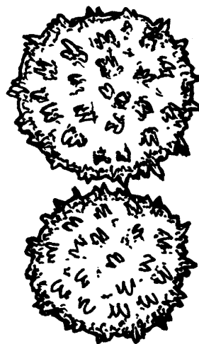
Рисунок 2 — Пыльцевые зерна хлопчатника ( Gossypium hirsutum L.)